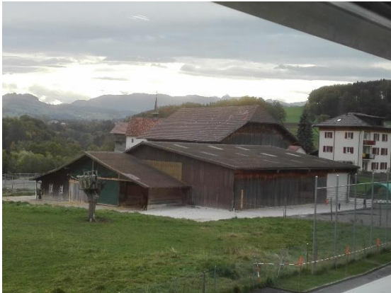
Kilátás az iskola ablakából

St. Ursenből visszatérbe a HEP-en folytatódott programunk.