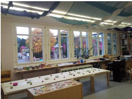
Óvodai foglalkozás előkészítve