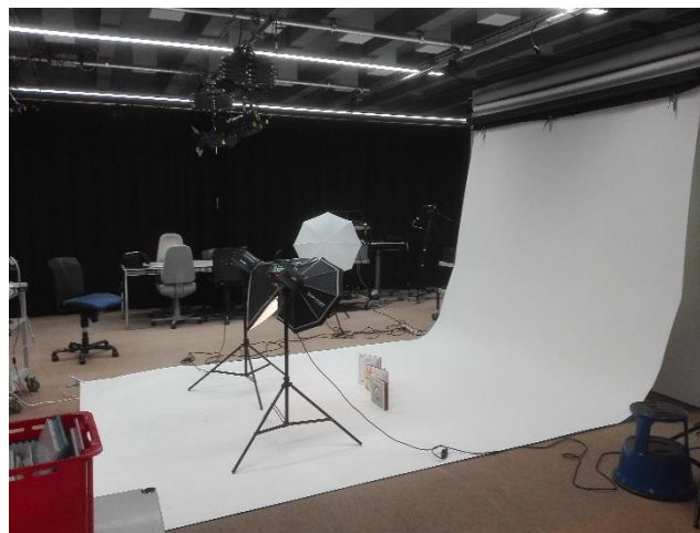
Pillanatkép az audio-videoközpontból

Az audio-videoközpontban lehetősége van a hallgatónak és az oktatóknak egyaránt minőségi hang – és videofelvételeket, fotókat készíteni a legmodernebb eszközök és technikák igénybevételére, képzett szakemberek segítségével.