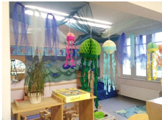
Részlet az osztályteremből

12:30-14:00-ig Mathelier előadás és műhelymunka