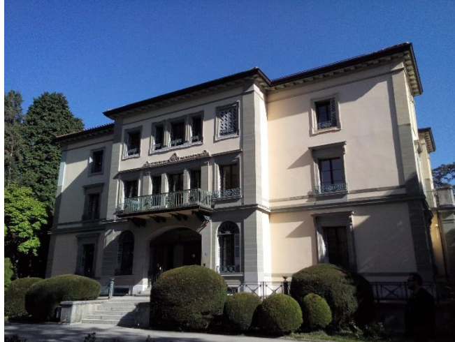
A HEP főépülete

13:30-14:00. Technikai megbeszélés a másnap sorra kerülő iskolalátogatásról (Christa Imwinkelried).