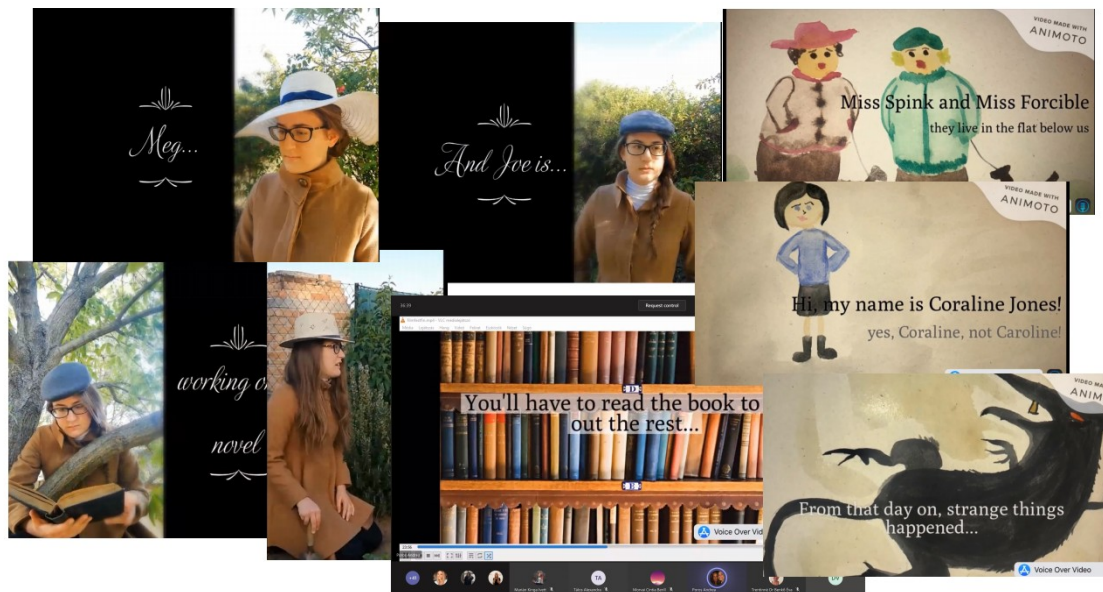
Students in Wonderland Filmfesztivál