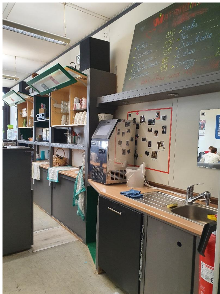
Hallgatók által üzemeltetett kávézó az egyetem épületében.