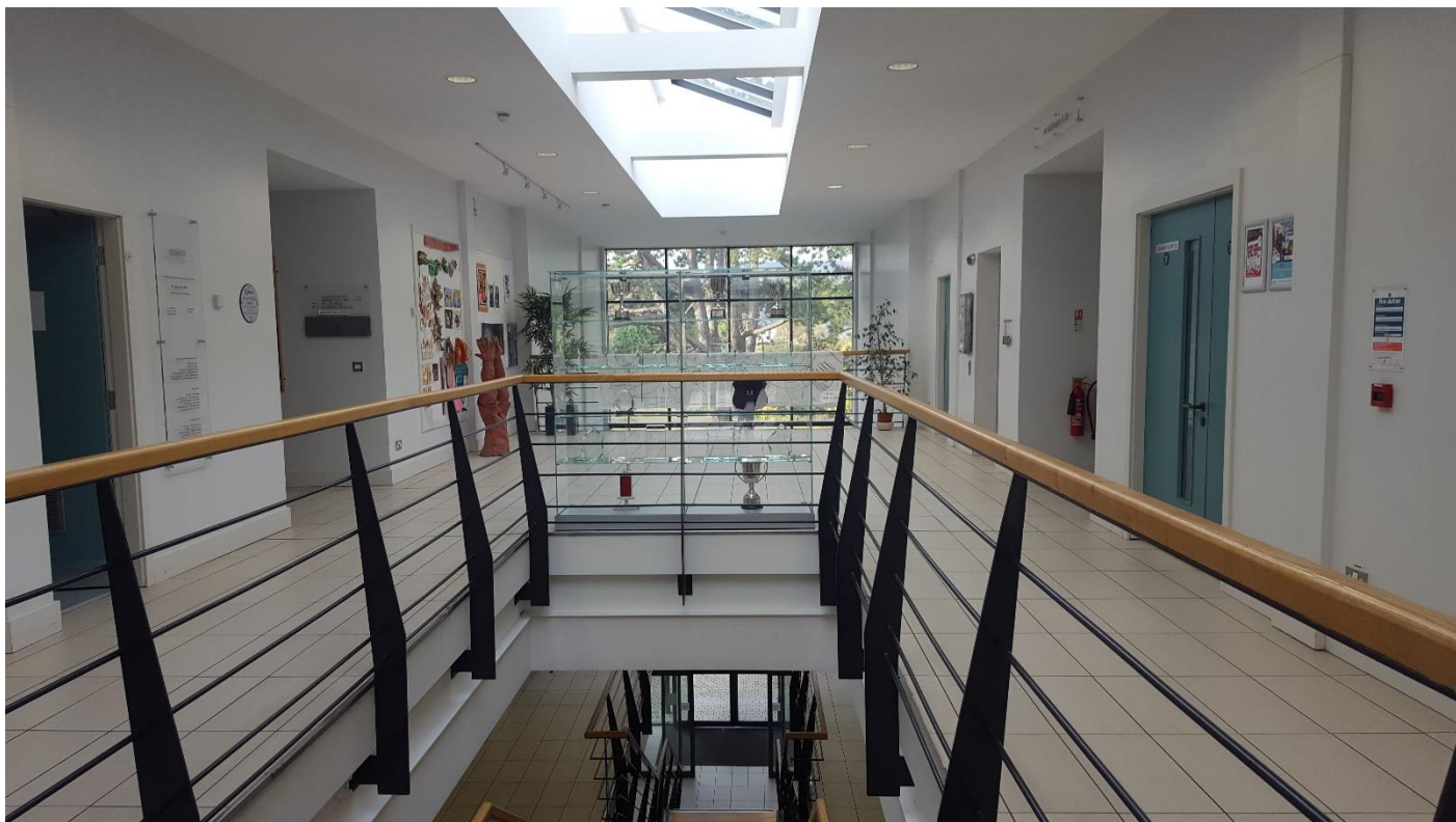
A vizuális, művészeti részleg emelete...