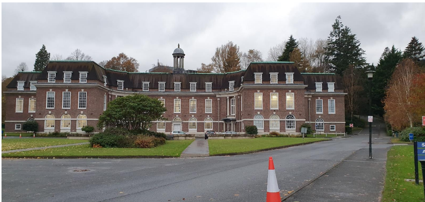
Az egyetem fő épülete