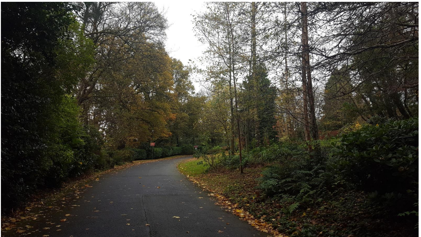
Az egyetem hatalmas parkja, mely az összes egyetemi épületet és kollégiumot is magába foglalja.