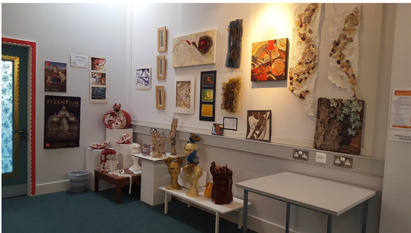
... és kiállításai.