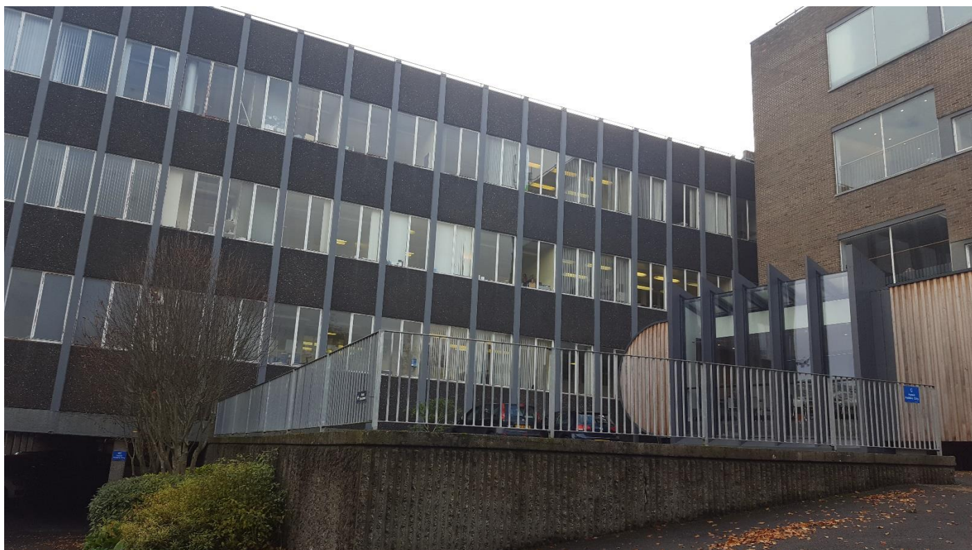
Az egyetem egyik újabb épülete, itt főként tanórák, illetve kávézó, étterem található.