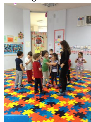
Óvodai angol foglalkozás

Az iskola bemutatása és a tanári karral való ismerkedés után két magas szakmai színvonalú óvodai angol foglalkozáson vehettem részt. A korai nyelvfejllesztést már a 4-5 évesek csoportjában elkezdik, az 5-6 évesek csoportjában heti hat órában tartanak játékos angol foglalkozásokat. Az iskolában az angoltanárok kiválóan beszélnek angolul és szakmailag rendkívül tájékozottak voltak.