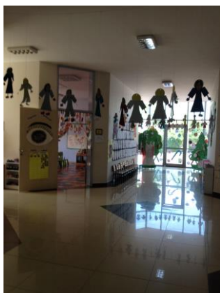
Az óvodai folyosó

Az iskola bemutatása és a tanári karral való ismerkedés után két magas szakmai színvonalú óvodai angol foglalkozáson vehettem részt. A korai nyelvfejllesztést már a 4-5 évesek csoportjában elkezdik, az 5-6 évesek csoportjában heti hat órában tartanak játékos angol foglalkozásokat. Az iskolában az angoltanárok kiválóan beszélnek angolul és szakmailag rendkívül tájékozottak voltak.