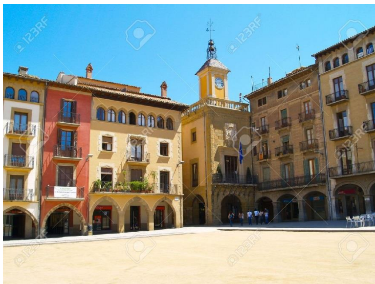
A város főtere - Plaza Santa Maria madártávlatból