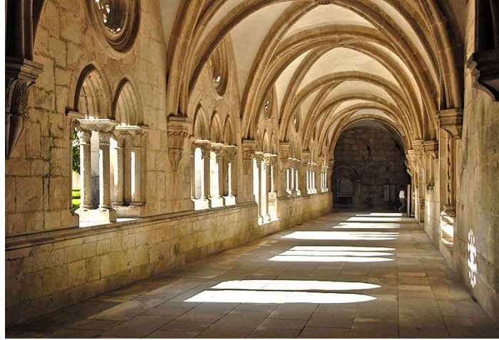
Ribes de Freses - Núria